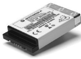
53963 – Bateria Li-ion de capacidade padrão