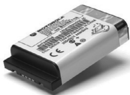
53964 – Bateria Li-ion de alta capacidade