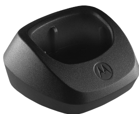
53962 – Base da bandeja do carregador