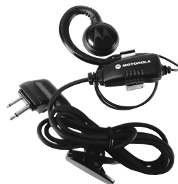
RLN6423 – Fones de ouvido giratórios