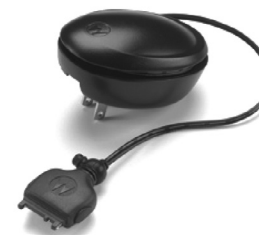
53969 – Fonte de alimentação para carga rápida de 1 hora